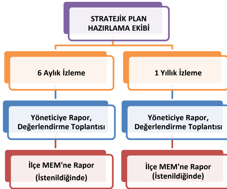
Şekil 2 İzleme ve Değerlendirme Süreci

Müdürlüğümüzün 2019-2023 Stratejik Planı İzleme ve Değerlendirme sürecini ifade eden İzleme ve Değerlendirme Modeli hazırlanmıştır. Okulumuzun Stratejik Plan İzleme-Değerlendirme çalışmaları eğitim-öğretim yılı çalışma takvimi de dikkate alınarak 6 aylık ve 1 yıllık sürelerde gerçekleştirilecektir. 6 aylık sürelerde Okul Müdürüne rapor hazırlanacak ve değerlendirme toplantısı düzenlenecektir. İzleme-değerlendirme raporu, istenildiğinde İlçe Milli Eğitim Müdürlüğüne gönderilecektir.